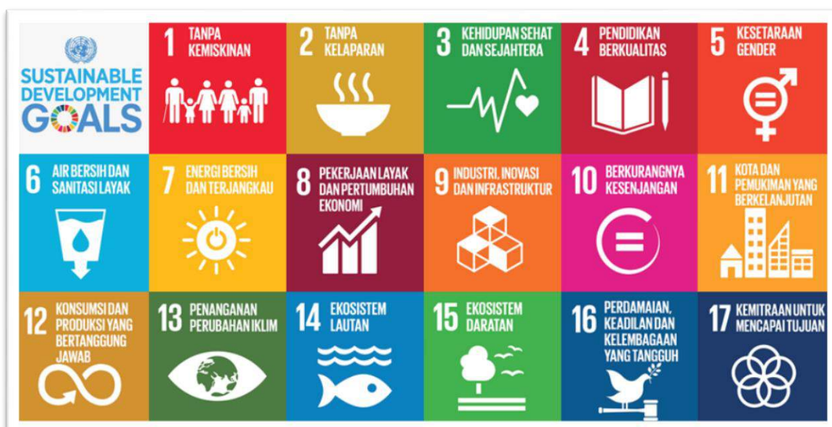
Gambar 3.1 Tujuan Pembangunan Berkelanjutan/Sustainable Development Goals (TPB/SDGs)

Dinas Dukcapil memiliki keterkaitan erat terhadap 3 (tiga) tujuan dari 17 Tujuan TPB/SDGs. Dua tujuan tersebut yaitu tujuan nomor 1, 16 dan 17: