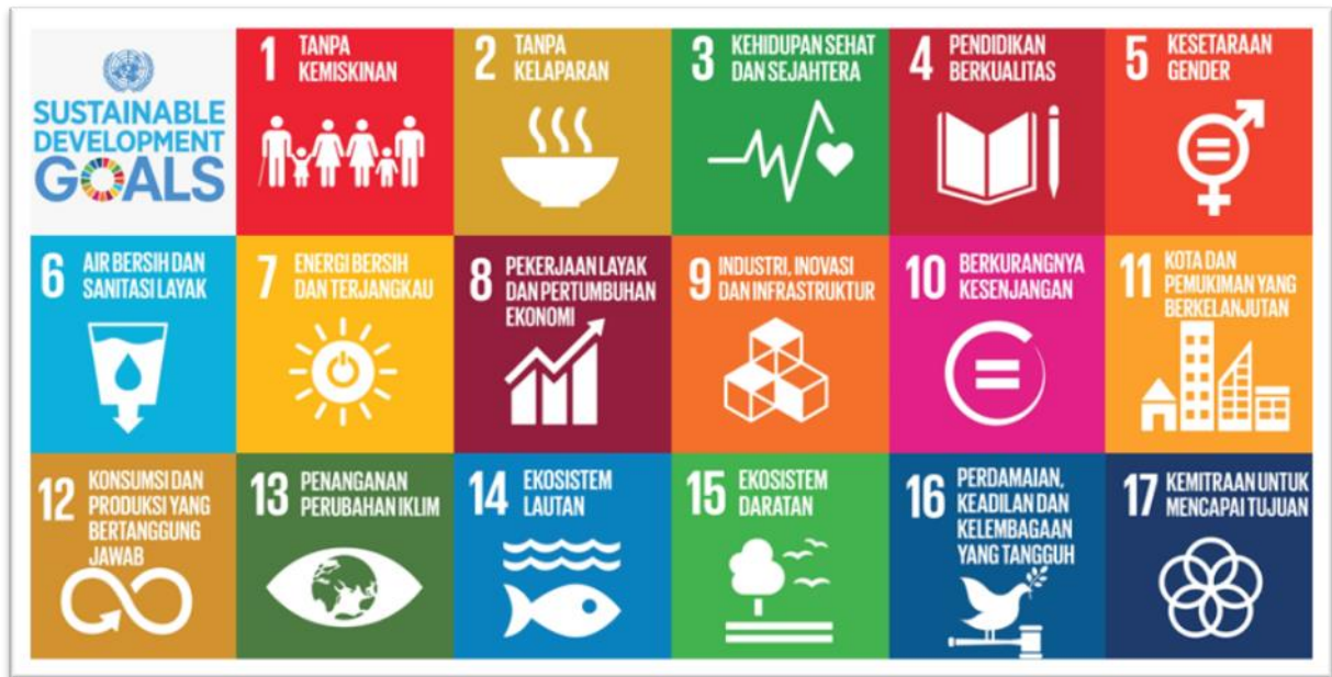
Gambar 3.1 Tujuan Pembangunan Berkelanjutan/Sustainable Development Goals (TPB/SDGs)

Dinas Dukcapil memiliki keterkaitan erat terhadap 3 (tiga) tujuan dari 17 Tujuan TPB/SDGs. Dua tujuan tersebut yaitu tujuan nomor 1, 16 dan 17: